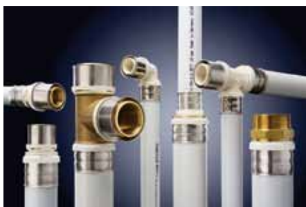
alplex L kompatibel zu alplex-duo/alplex-duo XS

Die neuen alplex L Fittings in der Dim. 75 aus entzinkungsbeständigem Messing komplettieren das System optimal. Der robuste und überaus langlebige Fittingkörper ist durch seine spezielle Legierung hygienisch einwandfrei und beugt dem Lösen von Kupfer und Zink in sehr weichen oder chlorhaltigen Medien vor.